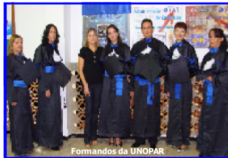
Formandos da UNOPAR

A primeira quinzena do mês de março, na Faculdade de Iporá – FAI, foi recheada de solenidades e festas, em clima de alegria, emoção e a certeza do dever cumprido, pois aconteceram duas formaturas: a da FAI, de 2 a 7 de março e a da UNOPAR, dia 12 de março.