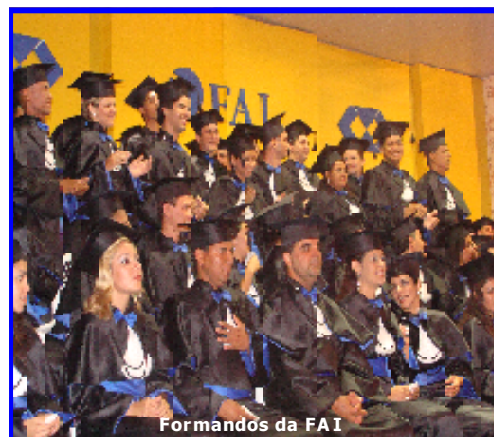
Formandos da FAI

As solenidades da formatura constaram de Aula da Saudade, Desencerramento da Placa, Culto Ecumênico, Colação de Grau e, para encerrar, um animado Baile de Gala.