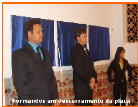
Formandos em descerramento da placa

As três placas, além de enfeitar o ambiente, registram, para a posteridade, o nome daqueles que foram os primeiros alunos da instituição, alunos estes que, em quatro anos de estudos e vivências acadêmicas não só construíram aprendizagens, como também construíram relacionamentos e se construíram/aperfeiçoaram como ser humano. Além de que colaboraram com o pontapé inicial da construção de uma longa história que promete ser, a da instituição FAI.