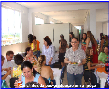
Concluintes da pós-graduação em almoço

O último Encontro do Curso de Especialização em Educação de Surdos/LIBRAS, dias 20, 21 e 22 de março, ocorreu em clima de festa.