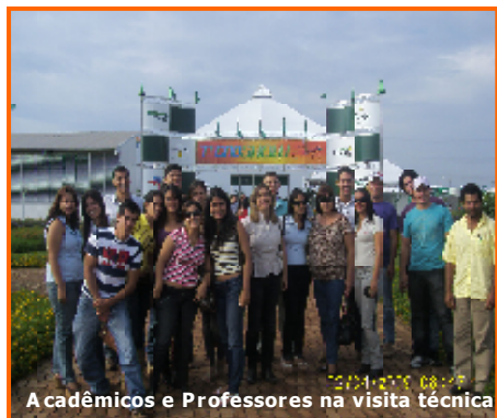
Acadêmicos e Professores na visita técnica

Uma formação superior adequada requer da instituição de ensino não só aulas teórico-práticas do conteúdo, como também uma maior interação com a realidade profissional vivida na área do curso ministrado.