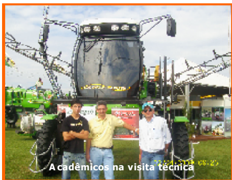
Acadêmicos na visita técnica

Nesse sentido, a FAI desenvolve importante estratégia de ensino visando a uma aprendizagem significativa, com a realização de visitas técnicas.