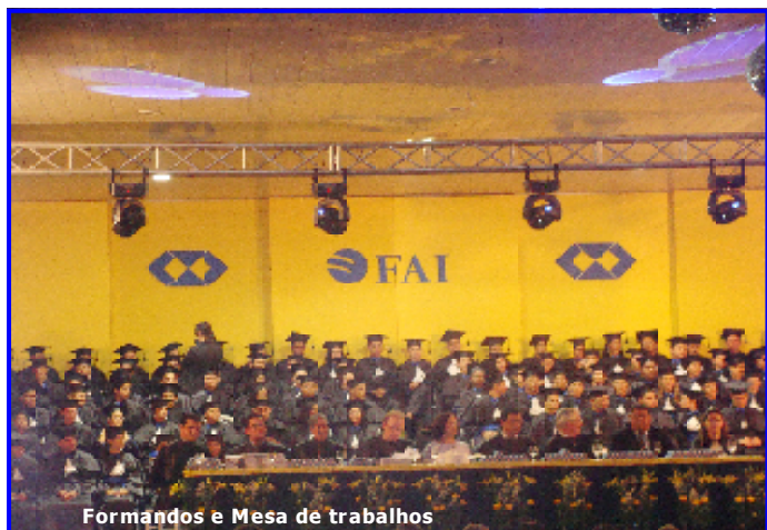
Formandos e Mesa de trabalhos

O mês de março foi revestido de significado especial para a Faculdade de Iporá – FAI, pois nesse mês, no período de 2 a 7, foram apresentados à sociedade de Iporá e Região, seus primeiros graduados em Administração – turma 2008.